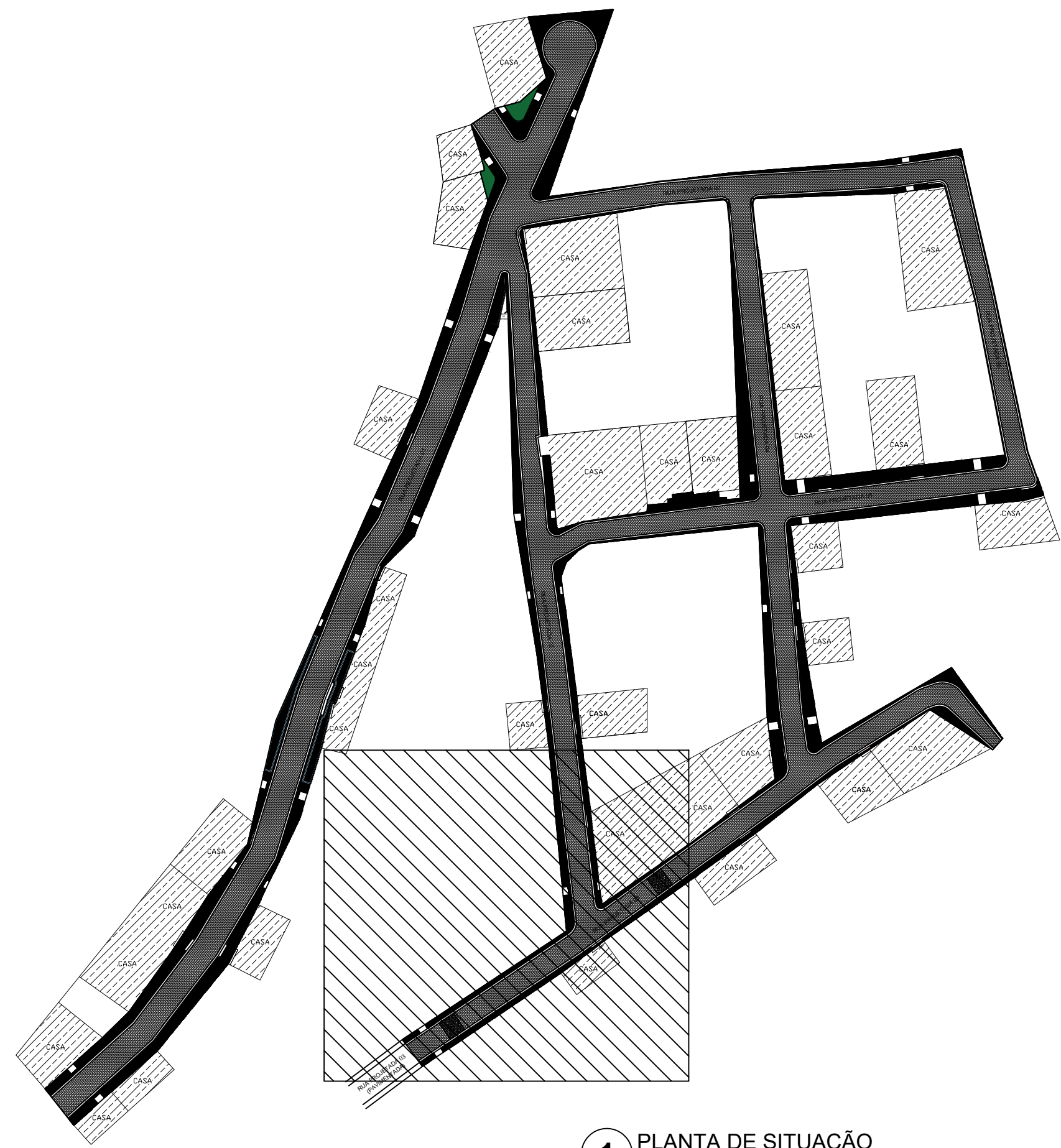
1 PLANTA DE SITUAÇÃO ESCALA 1/1000